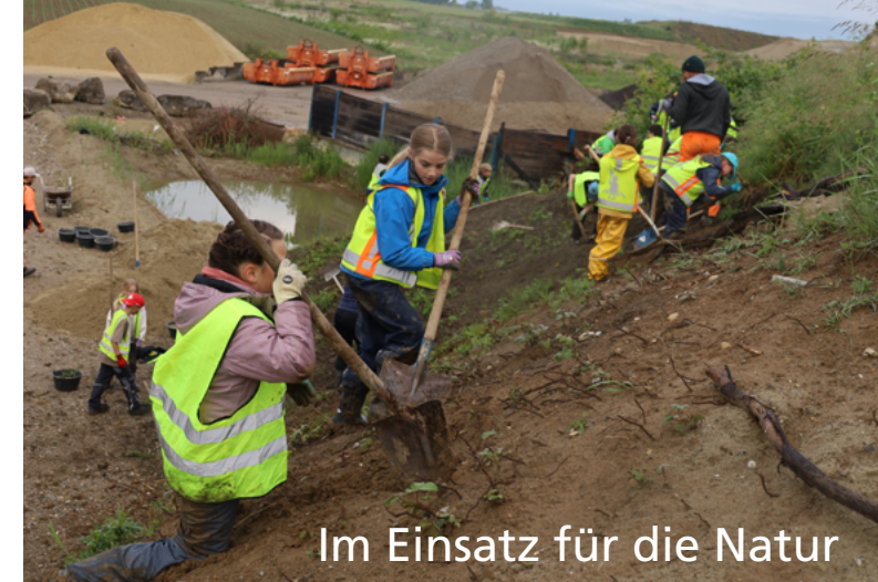
Im Einsatz für die Natur