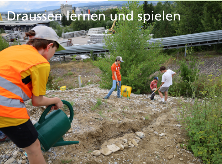
Draussen lernen und spielen